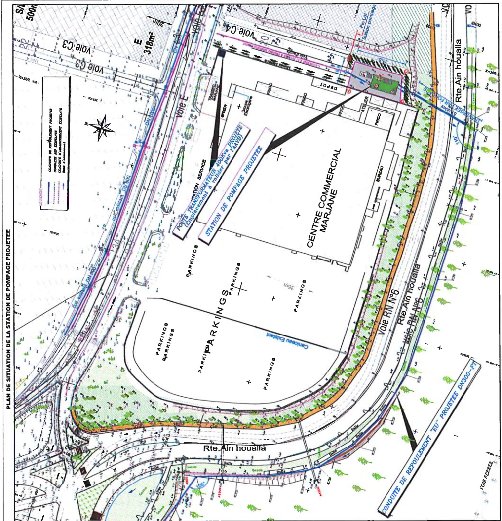
PLAN DE SITUATION DE LA STATION DE POMPAGE PROJETEE